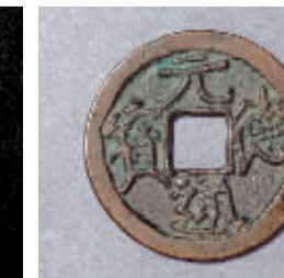
西夏元德通宝旋读,为著名之海内孤品