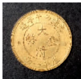
大清丙午年造大清金库平一两

从中国嘉德2006年春拍与2007年春拍比较来看,2006年春季一共有4场“钱币”专拍,上拍量为4566件,成交额为5436.6万元,成交率达到76%;2007年春拍则有7个专场,上拍量为6672件,成交额为8634.5万元,成交率达到77.4%,与去年同期相比成交额增长了54个百分点,而上拍量增长了46个百分点,整体呈现出上涨的趋势。这一方面是由于2004年以来的市场热度,促使钱币上拍数量剧增,基数扩大;另一方面,由于名家藏品的陆续上拍,致使拍品总体品质提高,因此,成交额和成交率的提高,也是意料之中的。可以说,钱币的市场是“名人专场带动了整体行情”。