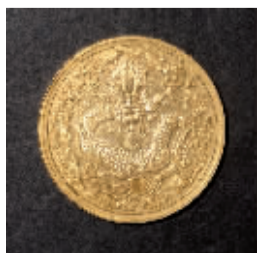
大清丙午年造大清金库平一两