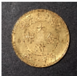
光緒丁未年造大清金库平一两