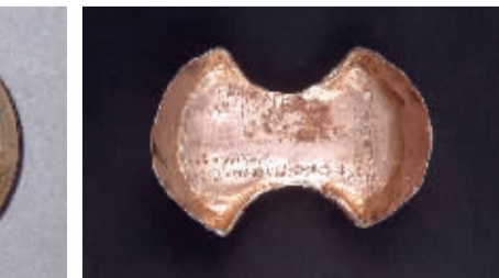
明代永乐六年银作局五十两银锭