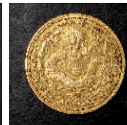
光緒丁未年造大清金库平一两