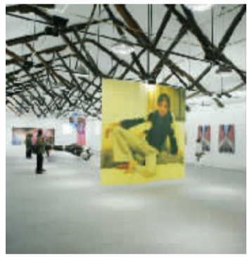
宋庄内的北京 TS1 当代艺术中心