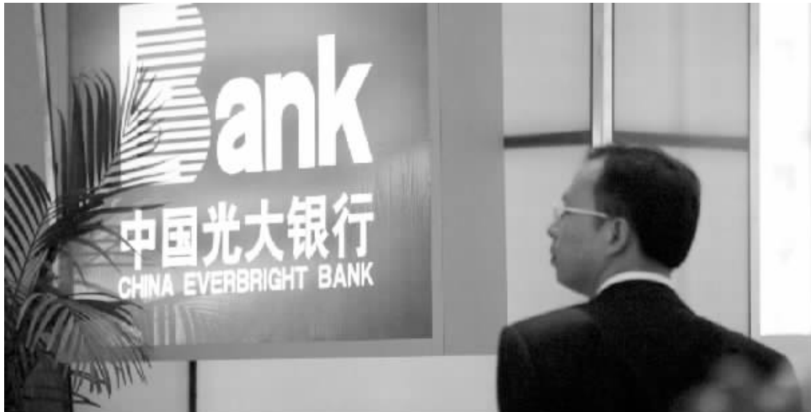
如何弥补37亿元历史亏损是摆在光大面前最棘手的问题 资料图

在提高资本充足率问题上,1月28日召开的光大银行股东大会已经批准发行不超过80亿元次级债券。而如果光大在上市前就完成