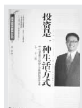
朱平 著 经济日报出版社 2008年1月出版

2005年初,一个偶然的机会使朱平抓起笔,希望能通过一些有趣的故事,吸引大家关注股市及其对未来的乐观预期。从那时起,他在多家证券报刊上推出了一系列特色专栏文章。3年了,身为广发基金公司副总经理兼投资总监的朱平业务越来越忙,先后停止了市场评论性及随笔性两类文章的写作,但仍想继续写一些趣味性、知识性和实用性相结合的小文,并开设了博客来与大家分享。他的企图是:能有越来越多的读者用投资的态度对待股市,把投资当作生活的一部分,不仅把多余的资金理性地用于投资,而是大家一起来共同建设一个诚信、透明的股市,实现属于大家自己的财富之梦。本书便是他的感想集,读者或许也可以借机从中透视一下著名的广发基金。