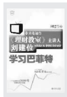
刘建位 著 中信出版社2008年1月出版

随着巴菲特价值投资思想在中国的传播,研究和实践巴菲特思想的专家也渐渐冒了出来,刘建位就是其中的一位。相信更多的人已经通过中央电视台“理财教室”栏目去年播出的十集系列节目《学习巴菲特》认识了他。古人云,大道至简,真正伟大的投资成功之道,其实只需很少的几个基本原则就可以概括,非常简单,却非常有效。在中央电视台的那十堂投资课中,刘建位就把巴菲特的投资之道归纳总结为十大原则,而在本书中,他更详细、更深入地剖析巴菲特的投资业绩何以如此卓然出众,巴氏的投资策略与众不同的精微究竟是什么。以刘建位的体验,说刘建位,只需要半小时,解释巴菲特,却需要一本书,实践巴菲特,则需要花整整一生。