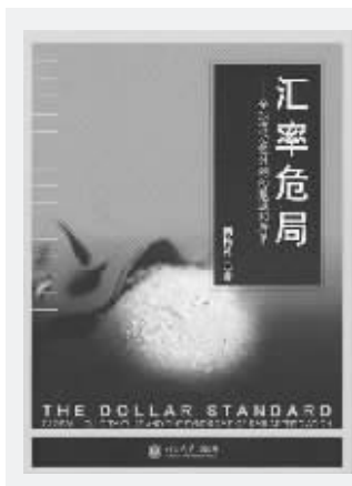
《汇率危局》 向松祚 著 北京大学出版社2007年11月出版