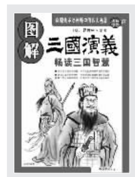
罗贯中原著 吴羽 编著 南海出版公司 2008年1月出版

以现代说法诠释中国古典名著的尝试多种多样,南海出版公司的选择是图解,本书就是该社“图解四大名著”系列中的一种,用“一页文字加一页图解”的手法全面解构《三国演义》的里里外外。《三国演义》是中国长篇历史小说开山之作,就像一个高品位而永不枯竭的宝矿,每个人在发掘这座宝矿之后,都会有属于自己的收获。这本图解分四部分:人物篇详细解构三国的典型人物,故事篇则图示三国的经典情节,寓意篇挖掘三国的深刻内涵,番外篇则介绍三国的相关文化及研究成果。为详解经典情节的来龙去脉,本书还涉及了《三国演义》的虚实之争、主题艺术、用人谋略等诸多热点,每一小节也都有相应的图解内容,比如人物关系图、活动路线图、服装兵器介绍等等。在编辑过程中,编者查阅了大量资料,重新绘制了大量形势地图。