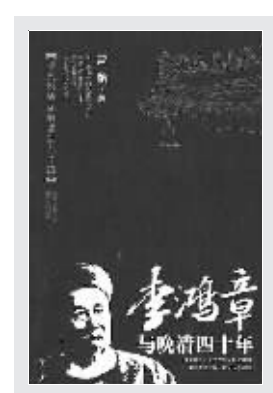
雷颐 著 山西出版集团山西人民出版社 2008年1月出版

李鸿章背了近一个世纪的骂名,他虽力所能及地推进洋务,推进改革,但终究“不敢破格”;他周旋于列强之间,功不可没,最终却落得“国人皆欲杀”。近20多年来,国内学术界在李氏的档案挖掘和还原历史本真上大大推进了一步。比如本书作者就花了番功夫去努力解读李鸿章从发迹到去世期间的重要奏折与信函,力图透过“台面”看“台下”,透过奏折“说什么”,看其真正想要“要什么”,还原了一个既要做官,又要做事,既要维新,但首先是自保的李鸿章。敢于做事而疏于自保,下场往往很惨;精于自保而不做事,只是滑头和饭桶,而李鸿章则是既敢于做事、开创新事业,又精于自保,擅于经营自己的势力,维护自己的利益。从这位晚清第一重臣的官场心机、政治手段中,又浸透了晚清帝国风雨飘摇中的苦涩与悲凉。