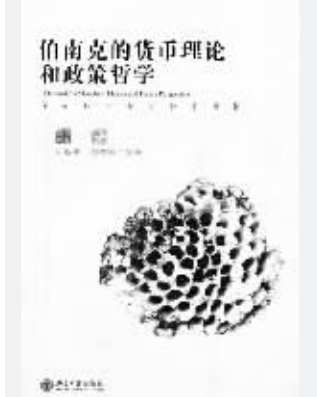
《伯南克的货币理论和政策哲学》 向松祚 邵智宾 著 北京大学出版社2008年1月出版