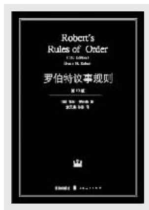
《罗伯特议事规则》(第10版) (美)亨利·罗伯特 著 袁天鹏 孙彦 译 格致出版社2008年1月出版