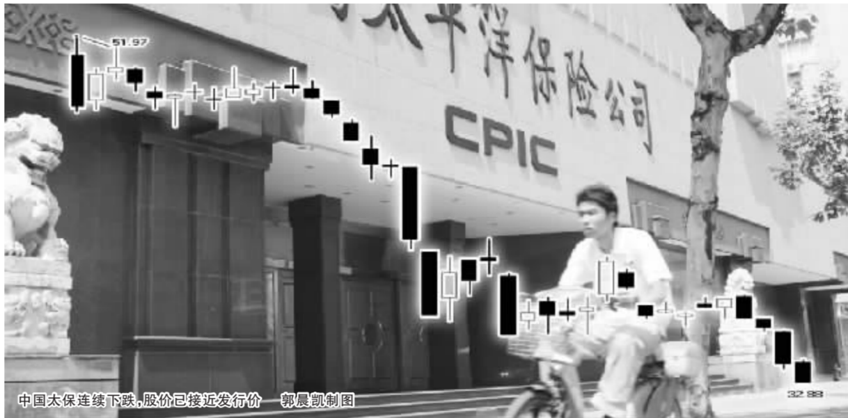
中国太保连续下跌,股价已逼近发行价

据了解,中国联通相关负责人已经出面澄清了“再融资”传闻,该负责人对媒体表示“上述传闻纯属谣传,公司不存在通过证券市场向