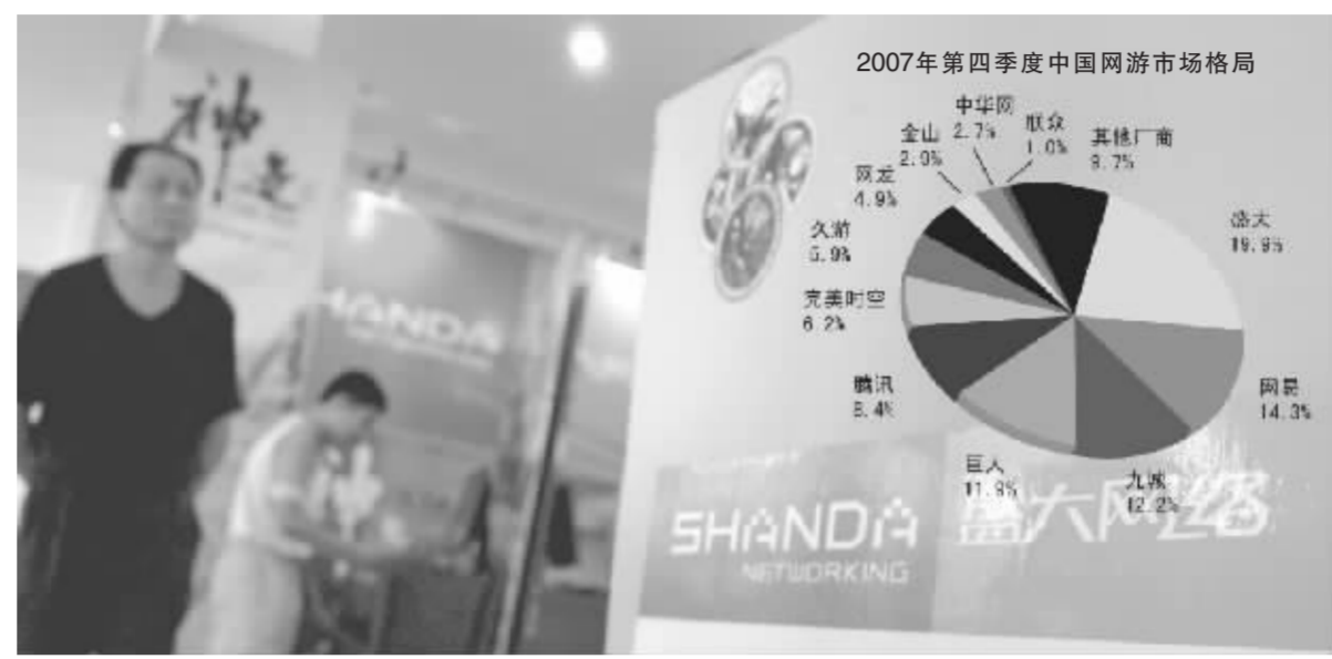
数据来源:易观国际 晨展凯 制图

紫金矿业在昨日公布的《通知》中称,经各级环保行政主管部门的认真审查和现场核查,国家环保总局向中国证监会出具了《关于紫金矿业集团股份有限公司上市环保核查情况的函》、《关于紫金矿