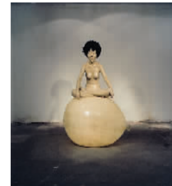
向京 彩虹 雕塑