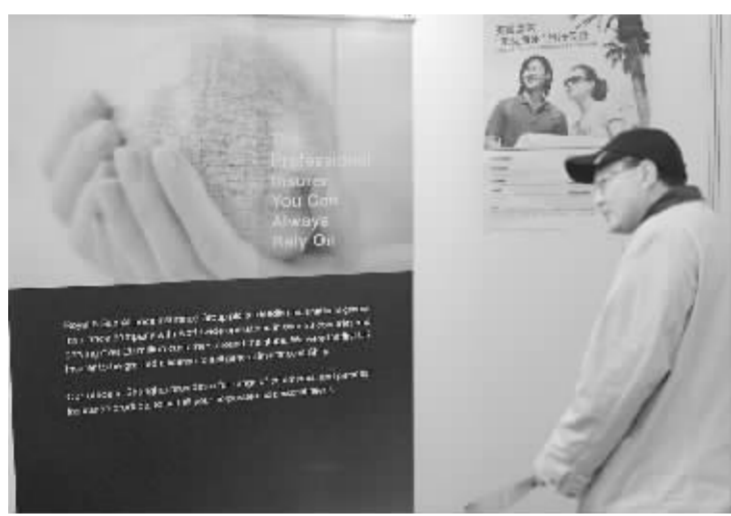
英国太阳联合保险(中国)公司一步到位增资至5亿元,扩张冲劲毕现 资料图