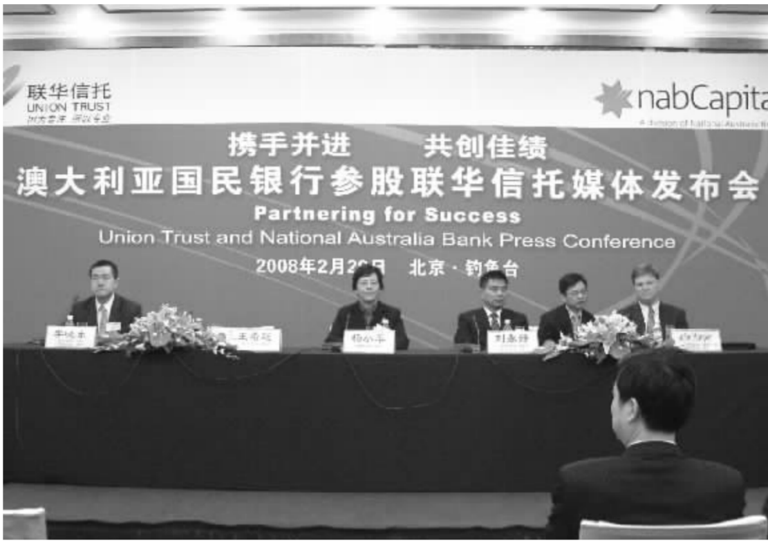
联华信托与澳大利亚国民银行长达18个月的“恋情”终于修成正果

澳国民银行始建于1893年,是澳大利亚证券交易所最大的上市金融机构之一,也是世界500强企业排名最靠前的澳大利亚银行。