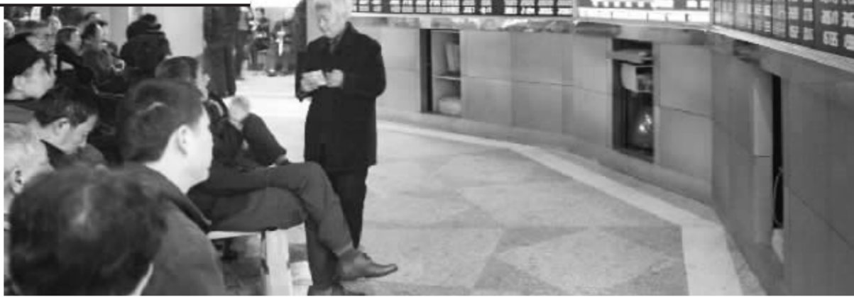
3月4日,投资者在重庆一家证券营业部内讨论股市行情

对于3月份股指的波动区间,上证综指在4200点-4800点之间为十大券商的主流观点,而4000点为机构预测的下限,上限则在5000点左右。例如,广发证券预测,3月份上证综指在4200-4500点之间整理后谨慎反弹,高度有望突破5000点;渤海证券认为4000点为股指中期底部区域,短期看上证指数将在4000-4900点之间宽幅震荡。