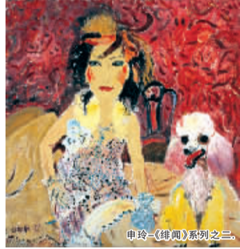
申玲《锦典》系列之二