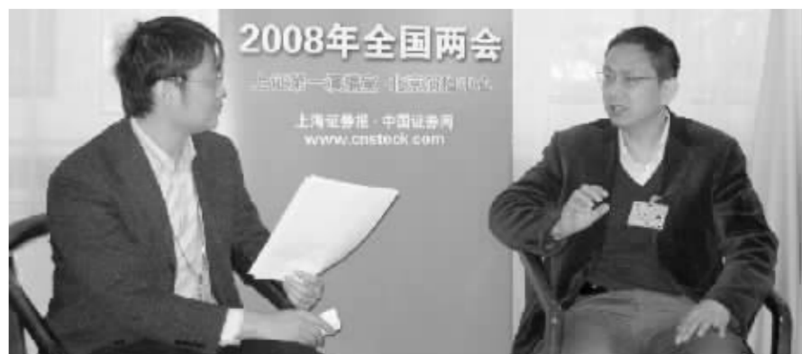
全国政协委员、财政部科研所所长贾康(右)昨天接受中国证券网邀请,就热点话题进行解析