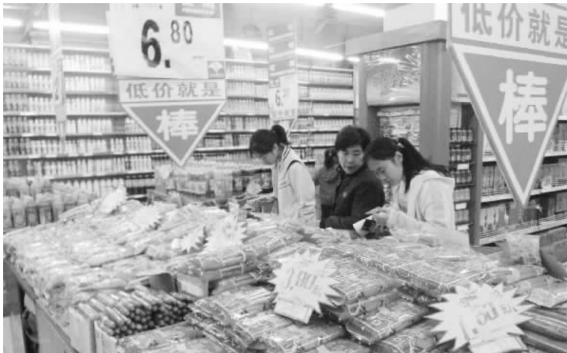
物价问题是当前社会关注的焦点 资料图

政府工作报告中提到,要推进经济结构调整,转变发展方式,坚持扩大内需方针,调整投资和消费关系,促进经济增长从主要依靠投资、出口拉动向依靠消费、投资、出口协调拉动转变。对于扩大居民消费方面,郑新立认为可以通过采取调整收入分配结构,加强社会保障体系及扩大就业,以及提高中低收入者的消费比例等措施来推动。