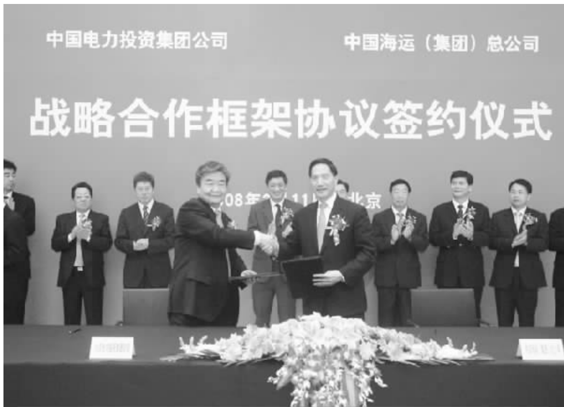
3月11日,中国电力投资集团公司与中国海运集团总公司在京签订《战略合作框架协议》

据悉,中电投集团是以电力、煤炭为主营业务,有色、化工、路港一体化发展的大型国有综合能源企业集团,可控装机容量4300万千瓦,原煤产能3500万吨,有色金属产能42.5万吨,旗下拥有六家上市公司,中国海运是我国最强的综合性航运企业之一,拥有船舶436艘,1768万载重吨,年运输量将超过4亿吨。