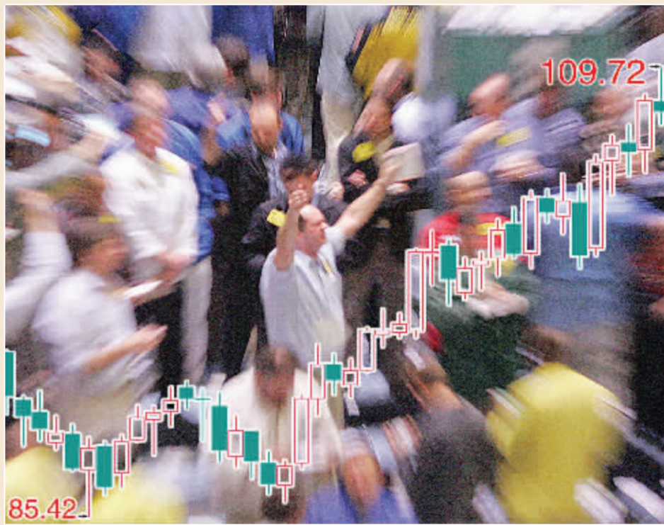
纽约油价再创历史新高 11日,纽约商品交易所4月份交货的轻质原油期货价格一度冲至每桶109.72美元,首次突破每桶109美元价位。 张大伟 制图