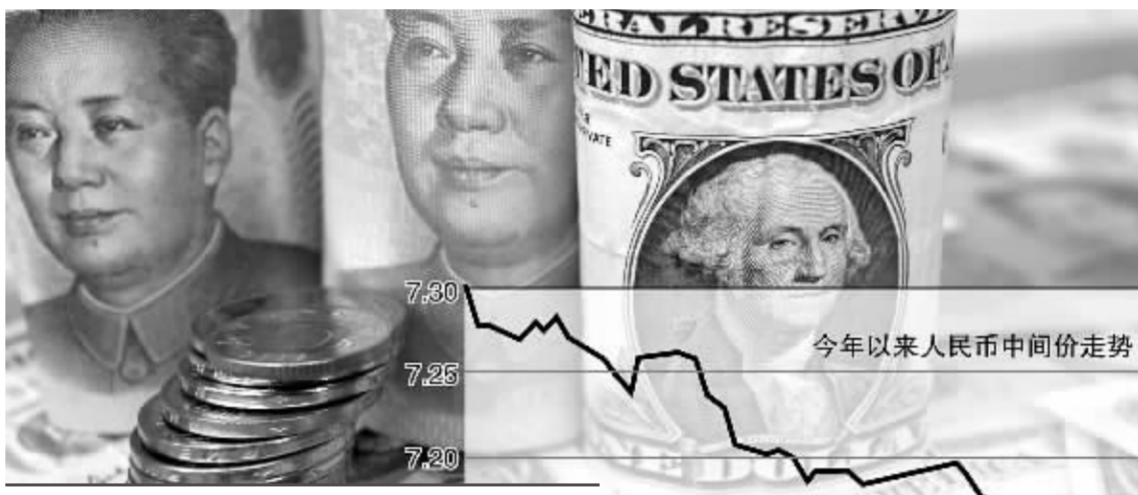
截至2008年2月,人民币对美元升值率约7.4%,但名义有效汇率和实际有效汇率仅分别升值1.0和4.7个百分点。

在供给方面,我国本轮物价上涨首先由粮价上涨带动,此后进一步受到肉、蛋、食用油、原油、金属