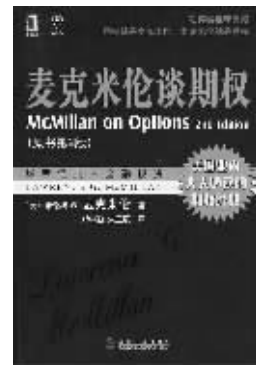
(美) 劳伦斯·麦克米伦 著 郑学勤 朱玉辰 译 机械工业出版社 2008年1月出版

中医诊所墙上多半会挂一幅人体经络和穴位图,这些经络和穴位的定位都是以积累了千年的中医经验为依据的,远不是一把手术刀所能揭示得了的。如果把美国金融市场看作一个布满经络和穴位的人体,把麦克米伦的经验和学识看作中医的实践经验,把麦氏所讨论的各种方法看作作是联络和控制这些经络运转的穴位,估计大家对这本书的理解可能会更贴切些。麦克米伦在国际期货界大名鼎鼎,被认为是全球最出色的期权交易员和分析师,衍生品交易奇才。本书是他的第二本书,初版7年后又增删了一部分,添加了交易所交易基金、电子交易、单只股票期货和波动率期货等内容。麦氏从一个实践者的角度,身体力行地从内部揭示了各个市场之间在运作中如何相互关联的机制。他反复强调的思想,就是利用不同金融市场中可以利用的各种手段,保住投资的既有盈利,同时也不放弃进一步获利的机会。