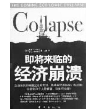
《即将来临的经济崩溃》 (美)斯蒂芬·李柏、格伦·斯特拉西 著 刘伟译 东方出版社 2008年1月出版

最佳投资四:中国和印度。中印两国均属于当今经济快速稳步上升的发展中大国,而且市场广阔,经济增长潜力巨大。在这个市场中,即使是大型公司,也能够像小型公司那样快速增加收