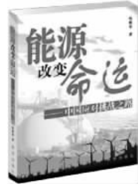
《能源改变命运》——中国应对挑战之路 陈新华 著 新华出版社 2008年3月出版

今天,我们所探讨的能源、环境与气候问题已经不是各自独立的问题,也不是某个国家或某些国家能够独立解决的问题。能源、环境与气候问题是相互联系、相互影响的全球问题,全球能源、环境和气候问题