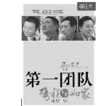
《第一团队:携程与如家》 朱砾石 马蕾 著 中信出版社 2008年1月出版

西方人对团队合作的理解跟我们有所不同。看看早期的一部美国连续剧《加里森敢死队》,5个不同的人,擅