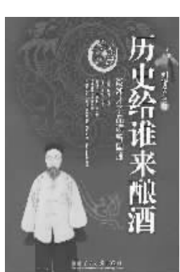
刘绪义 著 当代中国出版社 2008年1月出版

近年坊间关于曾国藩的读物真不少了,中国社会科学院哲学所博士刘绪义这本《历史给谁来酿酒》则不同于以往任何一部同题名的读物,是专门品鉴曾国藩的长篇历史文化评论,全面评述曾国藩做人做事是非因缘。有人评价说,它非小说,非历史,却充满了阅读的趣味。作者自述是以曾国藩的乡邻身份来评述曾国藩的,事先并没有任何先入为主之见,只求能更贴近他的生平际遇,贴近他身边的时代现实,贴近他身边的人和事。本书力求回到历史人物的生存境遇中,去挖掘他们的原生态形象。中国目前的情况是读者牵着作者和出版社的鼻子走,尚不见有谁有胆略去引导读者的阅读兴趣。怎样将历史写得既翔实深刻又鲜活灵性,尊重学术又不拘泥于学术而吸引广大读者,刘绪义以本书拿出了他的答卷。