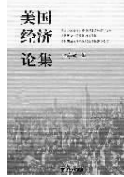
张宇燕 著 浙江大学出版社 2008年1月出版

张宇燕教授自称,随着这本论文集和另一部书稿《美国行为的根源》的完成,他对美国将近十七年的专门研究告一段落。可见,这本不厚的集子在作者本人心中的分量。张教授还引用一位前辈的话说,研究一个国家,当你对它知之甚少时,它是一个谜,当你对它深入研究时,它会变成更大的谜。对于美国来说,尤其如此。张教授的切入点是经济,本书有关“监管型市场与政府管制”、“基于利益最大化的美国行为”、“美元化;现实、理论及政策含义”、“汇率的政治经济学”等章节学术性非常突出,历史与现实并重,而在有关“美国历史上的腐败和反腐败”、“美国宪法的形成过程及其经济学含义”等章节中,张教授以其现代政治经济学的研究分析框架大大拓展了我国当代美国研究的视野。