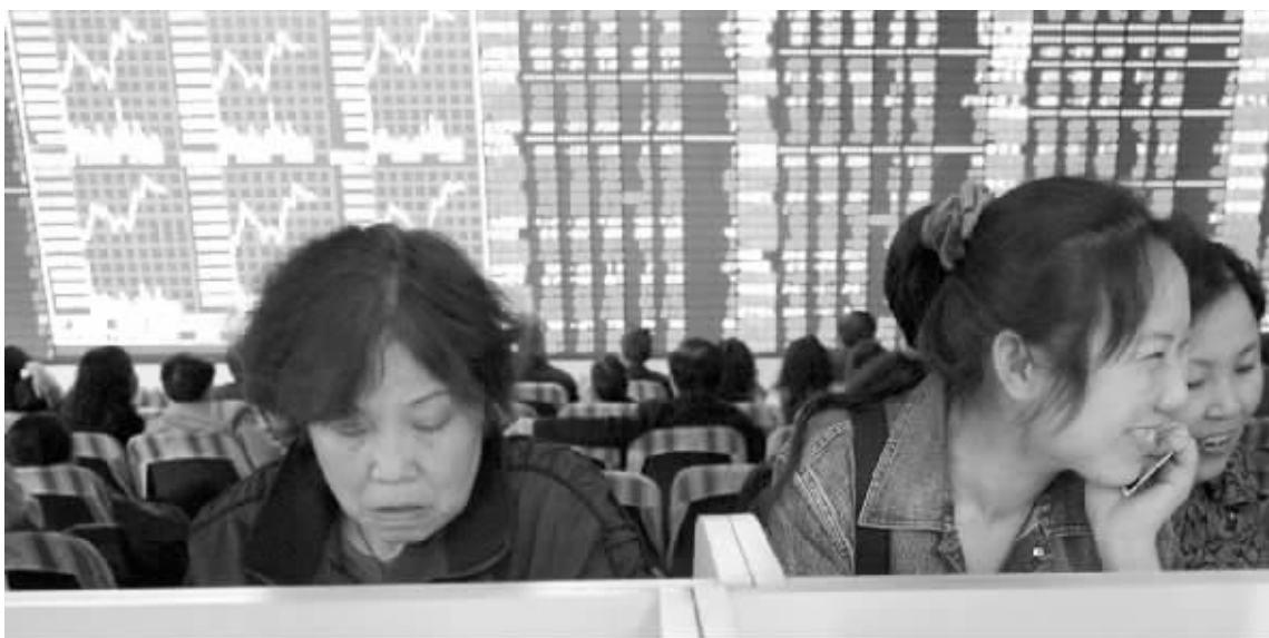
股市震荡反复,股民脸色也阴晴不定

经过长达 5 个多月的调整之后,大盘蓝筹股之间的分化已经出现,其中钢铁股、地产股等品种已得到增量资金的关注。不过,部分超级别权重股依然没有止跌迹象。自周一中石油跌破 20 元后,昨日盘中又