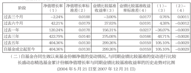
(二)自基金合同生效以来基金基金份额净值变动情况,与同期业绩比较基准的变动趋势比较 长盛动态精选基金累计基金份额净值增长率与业绩比较基准收益率的历史走势对比图 (2004年9月21日至2007年12月31日)