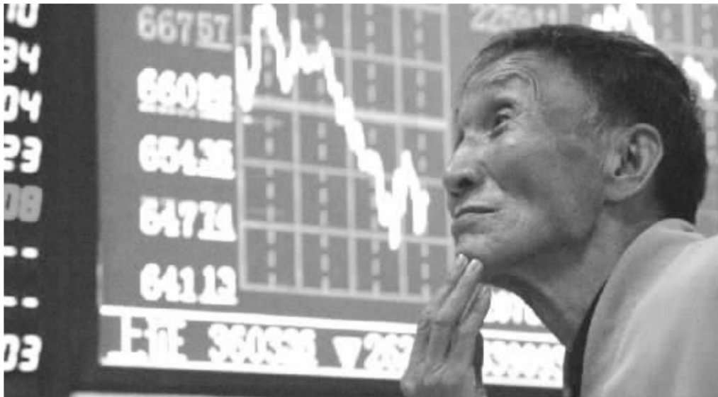
稍有回升的做多信心又遇到打击 资料图

业内人士认为,4月份“大小非”解禁对二级市场的压力大大减少,如果市场在近期大幅调整之后出现回暖,则将大大缓解解禁股的抛售压力。