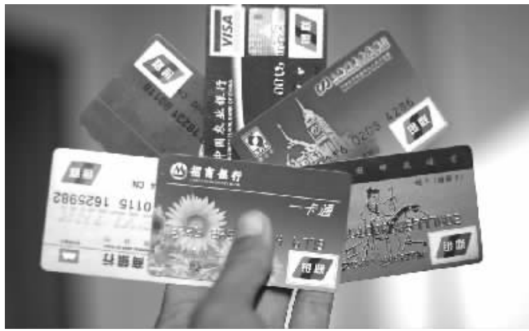
上海银监局调查发现,持有3-5张信用卡的人均授信额度为1.86万元 资料图

为此,上海银监局已向上海各商业银行发文明确提示相关风险,要求商业银行完善信用卡授信管理制度,在发卡时充分考虑持卡人在他行已获得的信用卡授信总额情况,避免多家银行多头授信导致持卡人累积信用额度过高,承担起相应的社会责任。