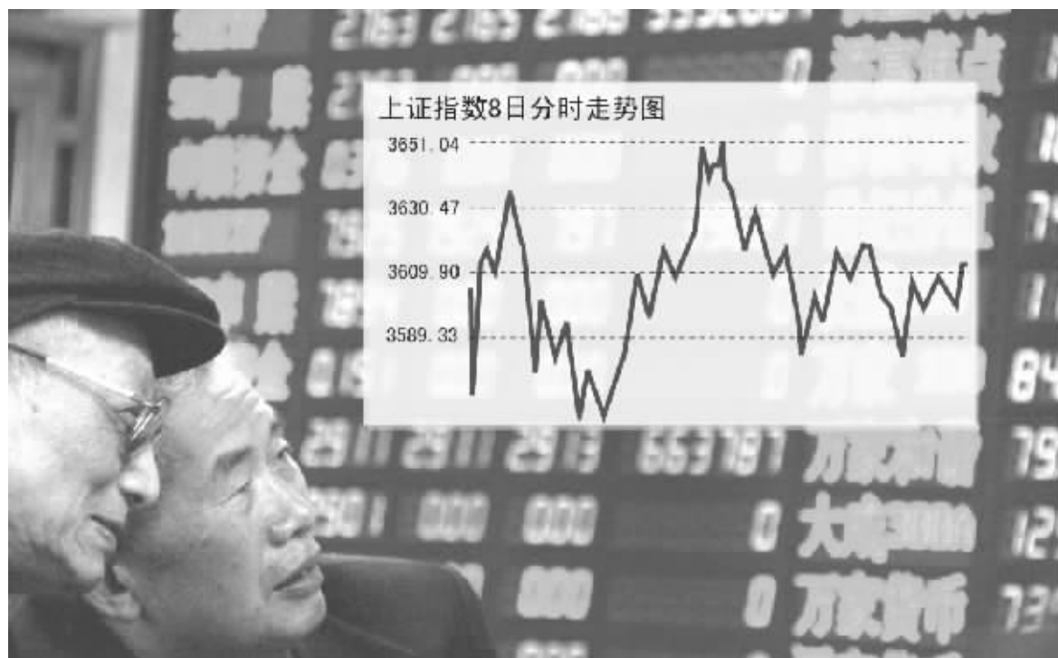
上证指数8日分时走势图

截至收盘,上证综指报 3612.54 点,上涨 12.92 点,涨幅 0.36%;深证成指报 13592.64 点,上涨 196.03 点,涨幅 1.46%。沪深 300 指数报 3891.06 点,上涨 45.24 点,涨幅