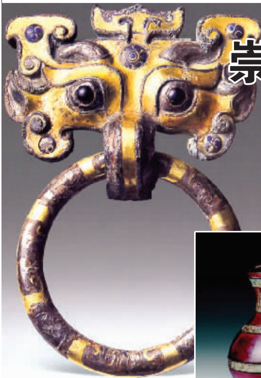
图为镶嵌琉璃错金银漆壶,估价待询