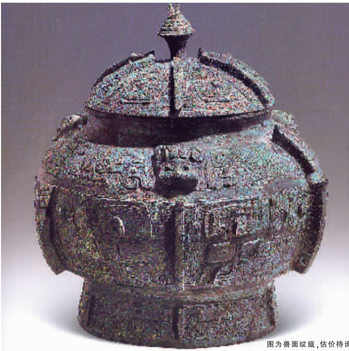
图为兽面纹甗,估价待询