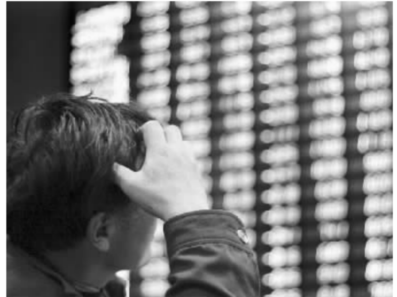
沪深股市缩量下挫,4月16日沪指跌56点收报3291点 本报传真图

与2006年以来的最高股价比,*ST大唐、苏宁环球、锌业股份、中色股份等185只股票被腰斩。而这三三百余只创新低的股票中,不乏大盘蓝筹股的身影。中国银行、中信银行、中国中铁、长江电力和华能国际,纷纷于本周的前三个交易日内,创出52周以来的收盘新低,其中,于去年上市的中信银行和中国中铁,还创出了上市以来的最低收盘价,双双向发行价格逼近。(张霄)