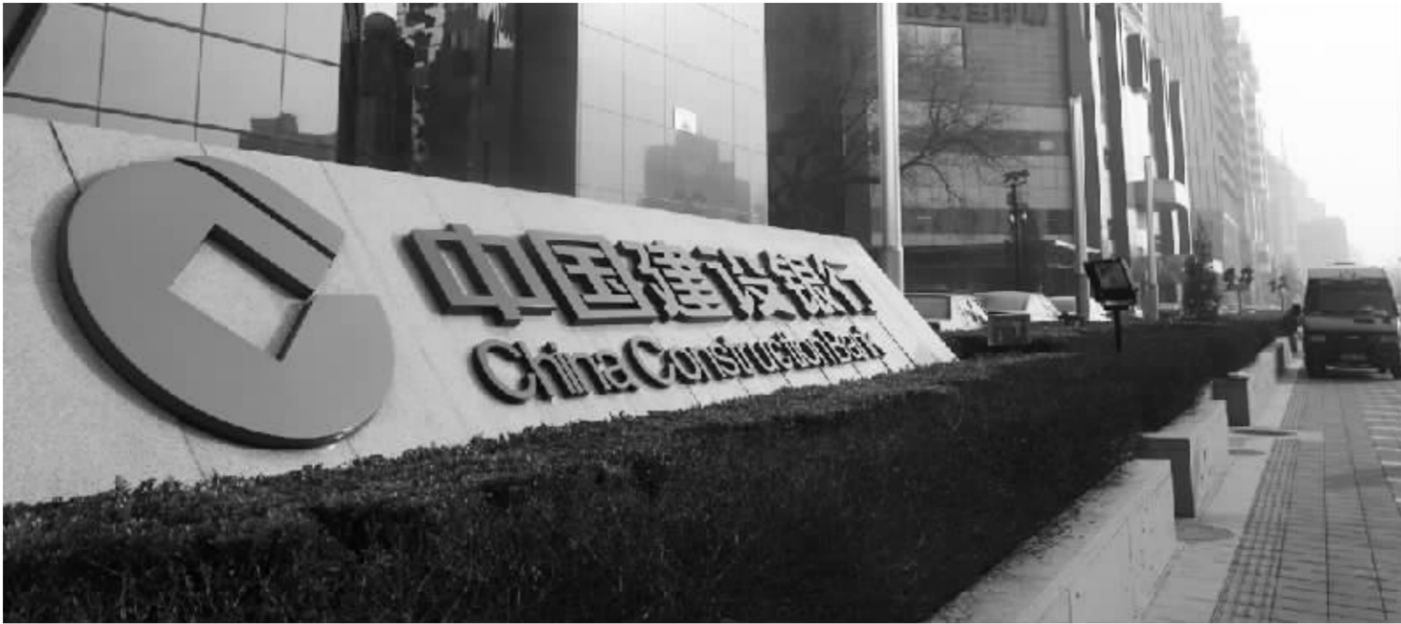
建设银行的赢利能力进一步提升,一季度存贷净利差扩大至3.12% 资料图

元以上的产品达到了16个,其中银行卡及收单、财务顾问、代销基金、承诺业务、代销保险、结售汇和代客衍生金融工具等7个产品收入超过6亿元。投资银行业务实现收入则较上年同期增长约2倍。