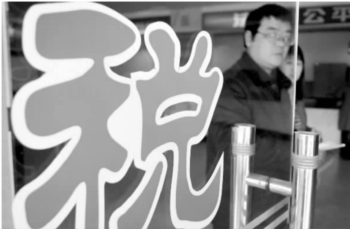
专家建议,减税的进程还应继续,尤其是在生产领域的增值税转型和个人所得税制度方面