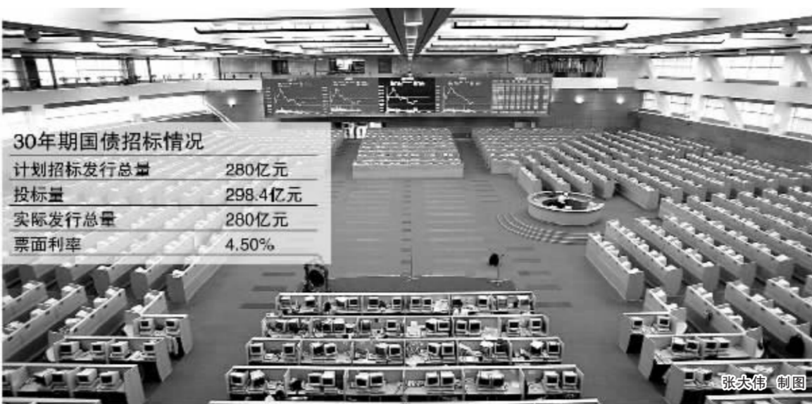
30年期国债招标情况