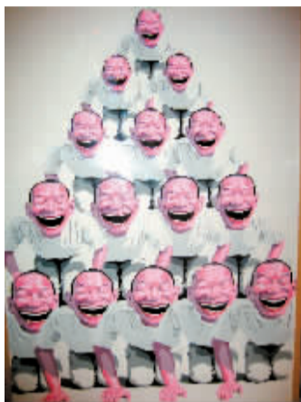
岳敏君《金字塔》版画