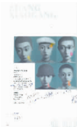
张晓刚大家庭全套5件

这些作品的表达非常接近西方的当代性,但又完全是中国特色。虽然他并不知道这些作品的作者是谁,但却当即决定购买。他不动声色地询问老板:“这些作品多少钱呀?”老板没有多想地回答:“2000-3000港币一幅。”陆仲远万万没有想到会如此便宜,立刻掏钱买下了所有的作品。