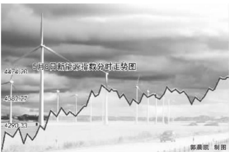
数据显示,该板块再度受到大量资金青睐,周四约有 14.3 亿元的资金净流入。事实上,各路资金对新能源板块的关注已经不止一日了。今年 2 月份在大盘调整过程中,新能源板块却逆势上攻,累计涨幅达 13.85%。4 月 22 日大盘见底

昨日新能源板块整体以 1.49% 的跌幅低开,此后便成为支撑大盘走强的主力军。尾盘半小时,该板块整体成交明显放大,在强势上攻中以整体 4% 的涨幅报收。板块内多达 75 只飘红,其中复牌后的力诺太阳连续 3 日涨停,包钢稀土、乐山电力和川投能源昨日也封上涨停,安泰科技、湘电股份、兰太实业、丰原生化等半数新能源股的涨幅超过 5%。