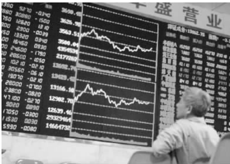
虽然指数表现平淡,但市场的做多热情依然不减 本报写真图

不过,虽然指数表现平淡,但市场的做多热情依然不减,压指数炒个股现象再度火爆,其中灾后重建题材相关的板块和个股纷纷逆势上涨。两市个股涨跌比约为 2.3,涨停的非 ST 股近 90 家,其中来自医药板块的品种便占了一半,该板块的整体涨幅也达到了 6.11%。农业、水泥、钢铁等板