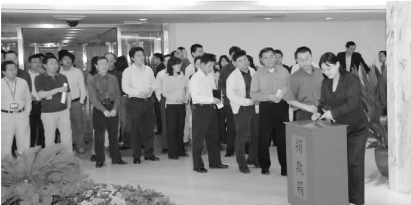
5月15日,证监会工作人员为灾区捐款