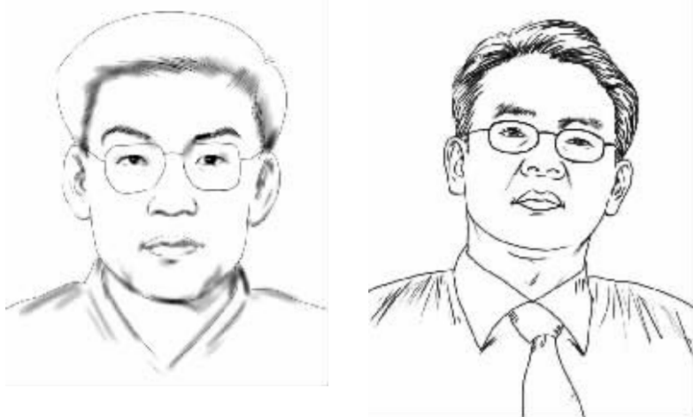
史培军,北京师范大学副校长,教授,博士生导师,民政部-教育部减灾与应急管理研究院副院长、国家减灾委专家委副主任、中国灾害防协常务理事。