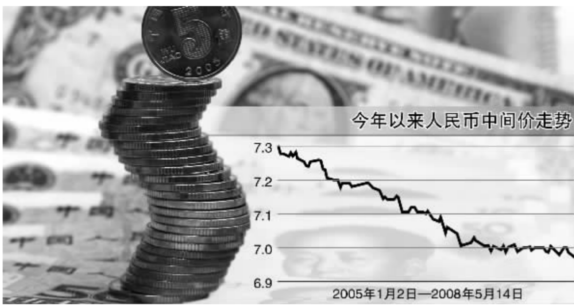
自4月份突破7.0元关口以来,在逾一个月的时间内人民币汇率中间价一直在6.98-7.0元之间宽幅震荡蓄势

中国人民银行昨日在公开市场发行230亿元一年期央行票据,比上周再减80亿元,创下了一月中旬以来的新低。