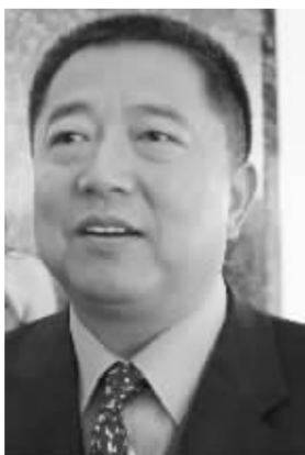
建业地产董事长胡葆森