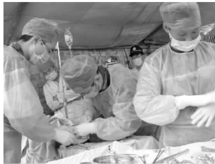
医生正在“帐篷医院”给患者动手术

当然,好消息也在不断到来。地震发生第二天,第二军医大学上海长海医院副院长孙颀浩就带领10名医生来到茂县,急诊由其全部包干。目前,长海医院已经有两批21名医生来到茂县,负责急救、治