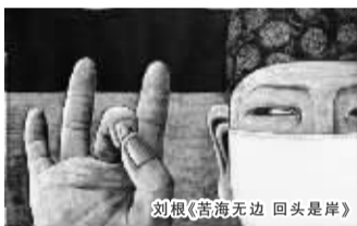
刘根《苦海无边 回头是岸》