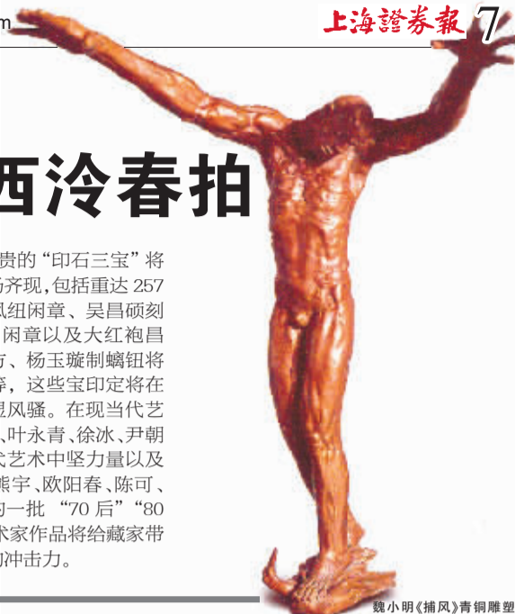
魏小明《捕风》青铜雕塑

名家印章,最名贵的“印石三宝”将在本此印章专场齐现,包括重达257克的田黄冻双凤组闲章、吴昌硕刻田黄“来修斋”闲章以及大红袍昌化鸡血冻石一方、杨玉璇制螭钮将军洞白芙蓉章等,这些宝印定将在整场拍卖中尽显风骚。在现当代艺术方面,周春芽、叶永青、徐冰、尹朝阳、钟飙等当代艺术中坚力量以及李继开、韦嘉、熊宇、欧阳春、陈可、高瑀等为代表的一批“70后”“80后”的新锐艺术家作品将给藏家带来独特而新鲜的冲击力。