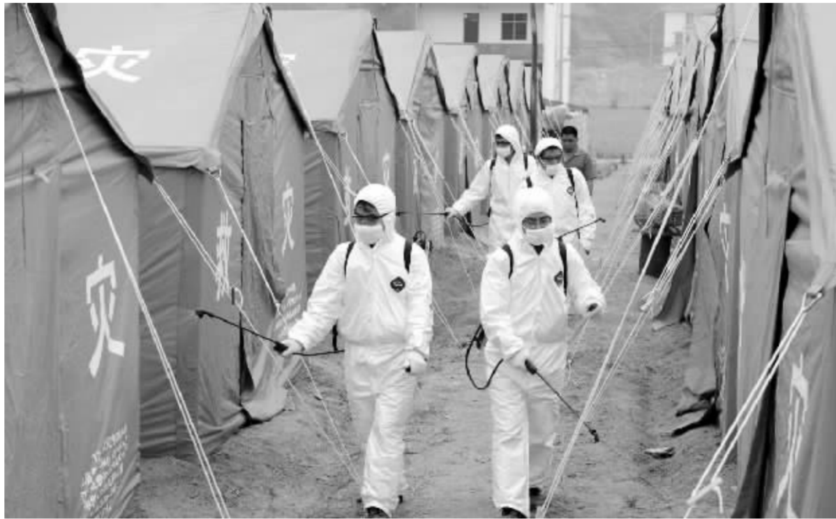
卫生防疫队在灾区群众安置点进行防疫消毒

这八项规定包括: 必须严格执行《审计署关于加强审计纪律的规定》和各项廉政纪律, 不得以任何方式与被审计单位发生任何形式的经济利益联系; 必须落实参加审计单位一把手责任制, 不得推卸责任、玩忽职守; 必须依法认真处理群众举报, 不得敷衍塞责、推诿扯皮等。