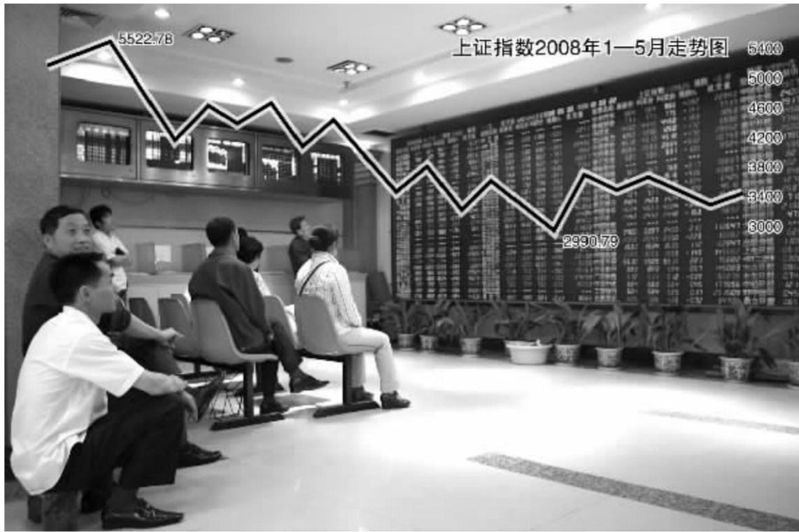
红五月已成泡影,红六月是否值得期待 张大伟 制图

尽管突如其来的地震灾难打乱了市场反弹的步伐,也加重了人们对于经济增长的担忧,但不少机构指出,2008 年全年经济增长动力依然强劲。东方财富网预测,考虑到地震灾害的影响,二季度 GDP 增速略有回落,三季度经济增速将会回升,全年 GDP 增速大体将与一季度持平,经济增长势头不减。银河证券看好上市公司 2008 年度业绩增速,认为