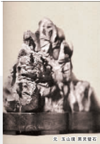
元 玉山璞 黑灵璧石