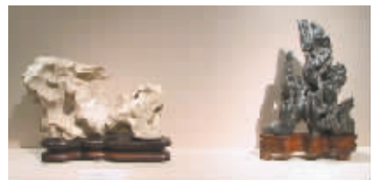
罗森布鲁姆藏石

“我的藏石中既有自然石,也有‘优化’石,因为我看中的是每块石头基本的内在吸引力。”所谓“优化石”,是指经过人工干预的赏石,有的藏家将其摒除在赏石范围之外。他还提出了自己选择古代赏石的价值标准:“如果要我列出文人石的优点顺序,那么会是这样:四面自然石,配有古雅的底座;从母体岩石分离的三面自然石,配有古雅的底座;经过优化的石头,凸现其现有优点,配有古雅的底座;经过雕琢的现代石,配有新的底座。”