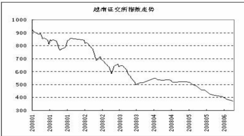
图1: 越南股指2008年来的走势图