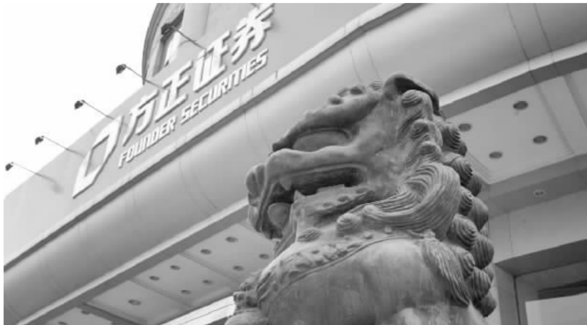
在新成立的瑞信方正证券有限责任公司中,方正证券出资66.7%;瑞士信贷出资33.3%,达到现行持股比例上限 资料图

正证券有限责任公司组建工作,足额缴付出资,选举董事、监事,聘任高级管理人员,并向工商行政管理机关申请设立登记,领取营业执照。 今年4月,本报曾报道瑞信与方正证券的合资计划有望成为券商合资新政下首家获批的合资券商。 根据《证券公司设立子公司试行规定》的要求,证券公司设立子公司,包括设立全资子公司均须满足两项硬指标:最近一年净资产不低于12亿元人民币和“具备较强的经营管理能力,设立子公司经营证券经纪、证券承销与保荐或者证券资产管理业务的,最近一年公司经营该业务的市场占有率不低于行业中水平。”在2007年度证券公司股票及债券承销金额排名中,方正证券的承销金额为81.85亿元,位列第23名。 虽然瑞信方正证券获批的牌照与上报的方案并无较大差别,但瑞信也曾表示,希望在中国法律法规允许时,能够在国内机构经纪和财富管理等领域拓展建立战略联盟,适时向监管部门申请拓宽合资公司的经营范围。根据《证券公司设立子公司试行规定》,“子公司申请扩大业务范围必须持续经营五年以上,信誉良好,最近三年无重大违法违规记录;最近12个月各项风险控制指标持续符合规定标准;具有持续盈利能力和较强的经营管理能力,最近一年主要业务