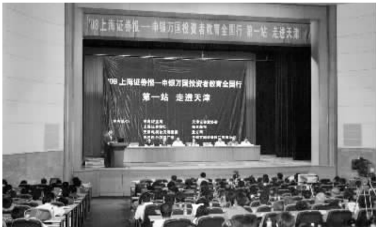
本报与申银万国再度合作,共同推进投资者教育工作深入开展