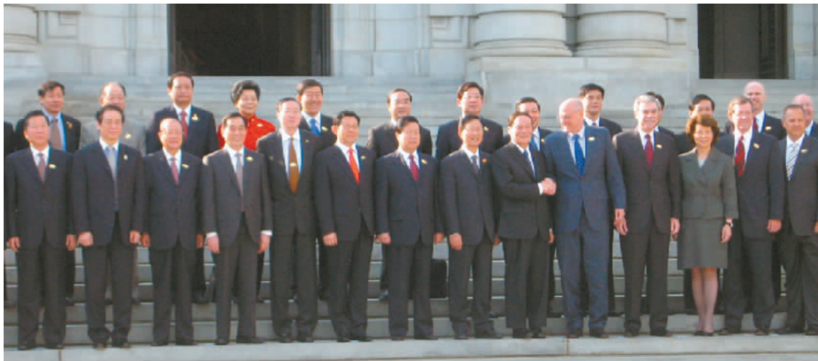
第四次中美战略经济对话与会官员合影