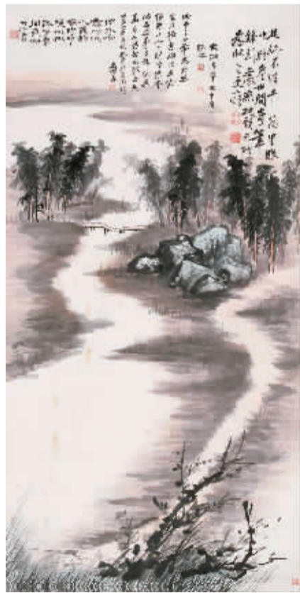
张大千《仿石涛山水》

此次嘉德四季第十四期拍卖会的瓷器玉器工艺品两个专场集中了600余件拍品,众多颇具特色的玉雕、象牙雕、铜像、观赏石、盆景等拍品上拍,全场总成交额达2600万元人民币,总成交率接近80%。在瓷器部分拍卖中,一件“绿地粉彩花卉双耳瓶”以53万元的成交价夺得该场桂冠。在玉器工艺品方面,一件“铜漆金达摩像”最终以接近60万人民币的价格成交,一件“清乾隆碧玉兽面纹炉”以高出估价6倍的价格成交,另外诸多碧玉作品也拍出了不错的成绩。刺绣作品中的一件民国时期的“民国缙丝挂屏(四件)”表现不俗,从底价起拍,最后拍得42万元人民币。盆景方面,本次上拍的这件画珐琅委角长方盆来自法国藏家,底落“乾隆年制”四字料款,景致优美典雅、寓意吉祥,最后以22.4万元人民币被买家竞得。