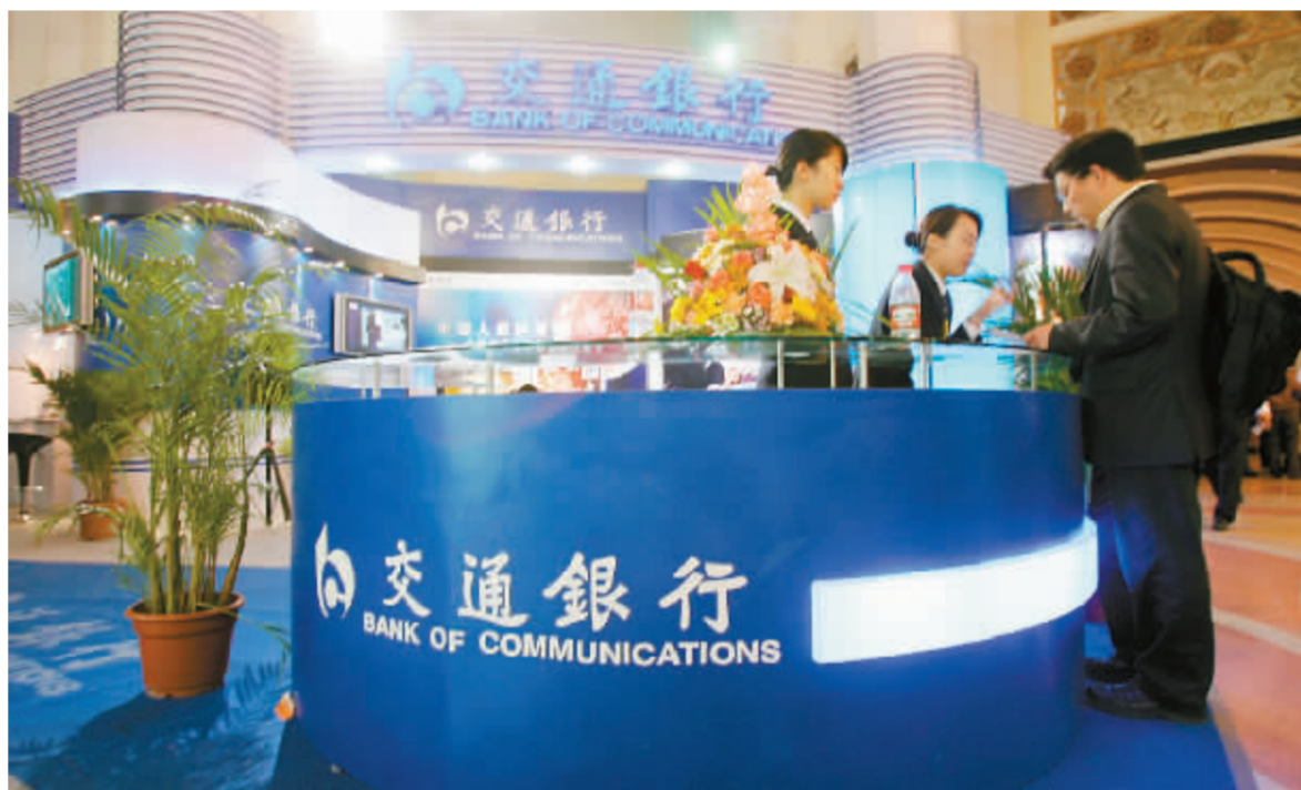
交通银行等金融股的AH股价已经接轨 资料图

近期两地市场均有所回调,但是A股回调力度明显超过港股,这使得A股对H股平均溢价再度明显下降,尤其是金融类股份。据统计,以昨日的收盘价计算,55只A+H股的平均溢价率约为83%,其中6只股份的AH价格出现倒挂。港股昨日受隔夜美股与A股市场大幅下挫的双重拖累,恒生指数再度失守23000点大关。恒生指数收市报22797.61点,跌528.19点,跌幅2.26%,大市成交缩量至590.36亿港元。国企指数收市报12431.44点,跌397.89点,跌幅3.10%。在A股的拖累下,中资股领跌市场,其中电信股、金融股、电力股以及石油石化股等板块集体跳水。尽管如此,港股的跌幅明显小于A股的6.54%。与4月中旬的数据相比,AH股的平均溢价由当时的135%缩窄至83%。据统计,55只A+H股中,共有6只股份的AH价格出现倒挂,分别是中国铁建-10.6%,中国中铁-10%,海螺水泥-9.5%,中国平安-8.2%,交通银行-5.6%,中国人寿-4%。同时,AH股溢价小于10%的股份也有6只,分别是中海发展1%、皖通高速2.7%,工商银行4.3%,招商银行4.6%,建设银行6.9%以及鞍钢股份8.7%。金融类股份的平均溢价均大幅下降。中国平安、中国人寿与交通银行三只股份的AH股股价已经倒