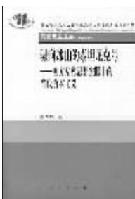
《驶向冰山的泰坦尼克号》 ——西方左翼思想家眼中的当代资本主义 陈学明 著 人民出版社 2008 年 4 月出版

我们了解、研究西方左翼思想家对当代资本主义的批评,目的还是为了更坚定地走中国特色社会主义道路。所以,西方左翼思想家对当代资本主义的批评所给予我们的启示,格外值得重视:当今的资本主义并没有经过自我调节而成为人类最美好的制度,当今西方极端的市场经济体制并不是能医治百病的灵丹妙药,当今资本主义的民主制度并不是值得我们照搬效法的一种政治体制,当今的资本主义社会所存在的种种弊端根源在于资本主义制度本身。