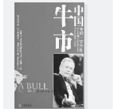
《中国牛市》 罗杰斯 著 中信出版社 2008 年 1 月出版

最后再看特立独行。当“中国威胁论”和“中国崩溃论”在国际社会盛行时,罗杰斯不为所动,多次中国之旅,零距离考察中国,给了他保持特立独行最大的勇气。他说:“赶时髦从来不是我的风格。远离人群的时候,通常才是我最好的投资时机。”他在书中提醒读者“想在中国投资致富要有你自己的路线,你要调动自己的激