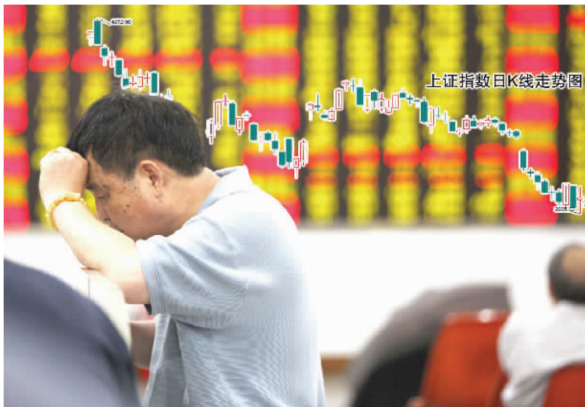
海通证券、东方证券一致认为, 市场短期对宏观基本面过于悲观 张大伟 制图

海通证券表示, 在 2008 年、2009 年 GDP 增速逐步放缓, 上市公司业绩增速下降, 市场资金趋紧的局面不会得到根本改变以及外围市场未见好转等多种因素的影响下, 投资者将更加谨慎, 对股票的风险报酬率的要求提高, 从而会抑制股票价格的单边