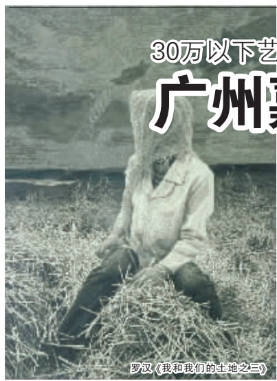
罗汉《我和我的土地之三》