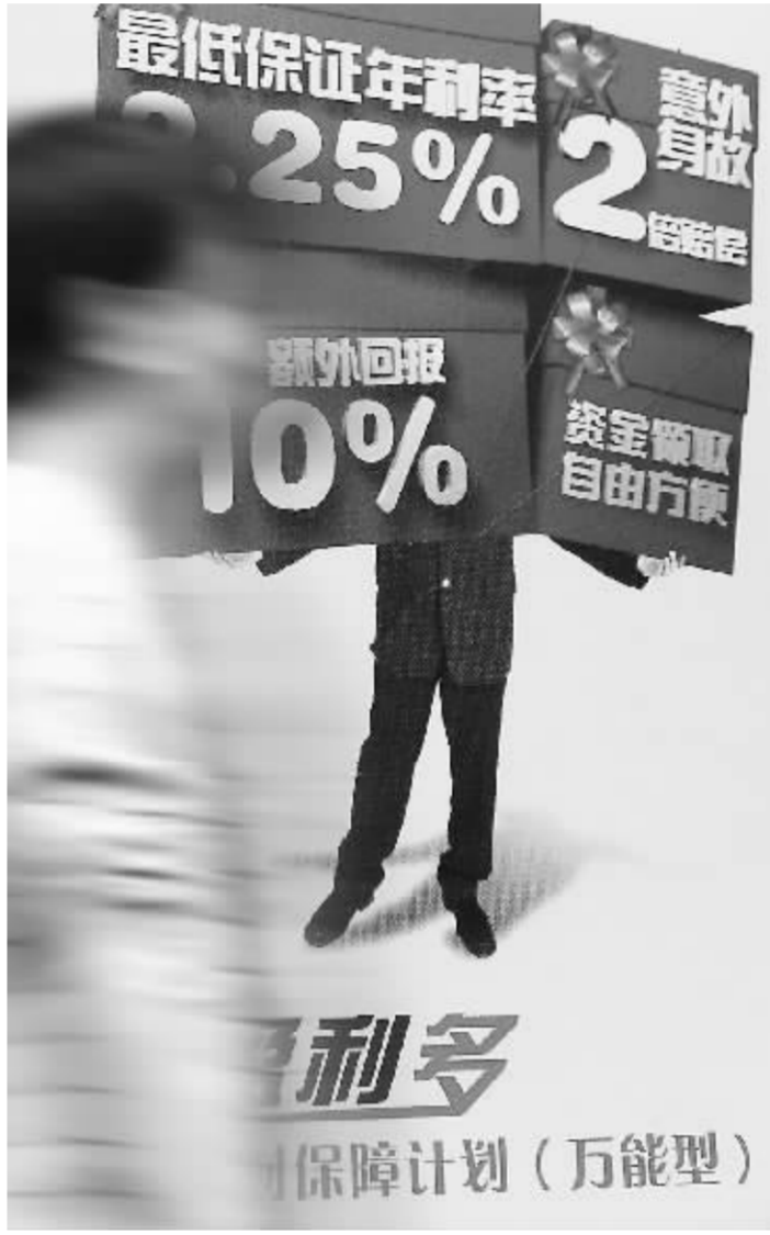
调高万能险结算利率可使保费收入激增,为此保险公司不惜赔本赚吆喝

对于该融资方案,昨日招行股东大会以特别决议形式通过了在境内及/或境外市场发行次级债券的议案,赞成投票股东超过90%。同意招行在境内及/或境外市场发行总额不超过人民币300亿元或等值外币计算的次级债券,以补充附属资本。若招行同时在境内外市场发行次级债券,则在境外市场发行的次级债券总额折合人民币不超过100亿元。招行公告称,有关发行次级债券的具体方案尚需相关监管部门批准,方能正式实施。