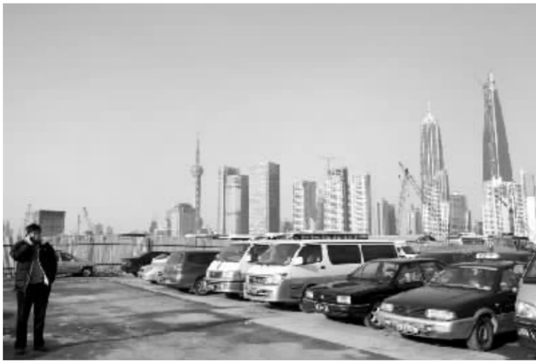
浦东新三年改革率先在人才引进领域入手 资料图

浦东的改革跟全国其他几个综合配套改革试验区不同,包括天津滨海新区在内的其他几个综合配套改革试验区目前正处于起步阶段,而浦东已经走过了这个阶段,因此急需在某些方面进行突破。“浦东新区金融办一位官员在接受记者采访时表示,这位官员表示,在经历了三年的改革和探索之后,浦东已经为下一步的改革打下了坚实的基础,但也遇到了一些瓶颈,比如在金融人才的引进方面,虽然目前上海已经聚集了大量的金融人才,但同其他国际金融中心城市相比,上海的金融人才尤其是高端金融人才还是非常匮乏。”