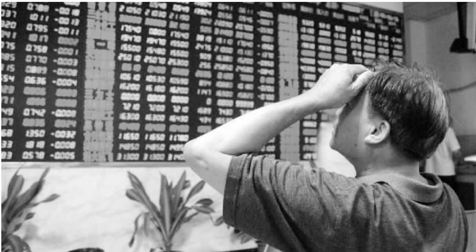
业内人士认为,在股市连续下跌的过程中,上市公司通过增加分红,或许是挽留投资者信心的一个好选择 资料图

此外,也有东方证券上海定西路营业部的投资者对记者无奈地表示,无所谓不分红了,即使分了