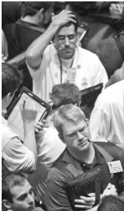
油价屡创纪录

报告还预计,全球清洁能源投资总额到2012年将达到每年4500亿美元,到2020年将超过每年6000亿美元。(柯贝)