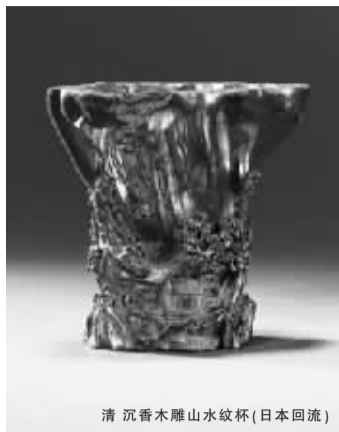
清沉香木雕山水纹杯(日本回流)

多为案供佳作,其中《明宣德青花缠枝花卉纹碗》,曾于香港佳士得拍卖公司早年拍出,数据详尽,参考详实,最终以59.36万元成交;该板块的第三个专题“玲珑佩玩”则多以玉雕、珠宝等佩玩小件为主,其中一件《元代白玉雕春水》摆件是元代圆雕中的名品,得自海上老藏家旧藏,十分难得,以16.8万元被藏家收入囊中。