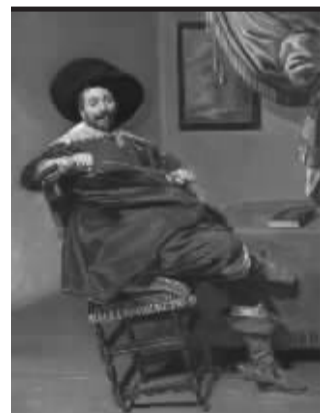
哈尔斯 威廉姆 范 海耶森