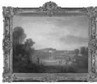
透纳《崔克海姆的教皇别墅》

2008年伦敦的夏季拍卖基本结束,无论是之前的印象派和现代艺术拍卖还是当代艺术的拍卖,再到这次大师作品拍卖。作为全球第二大拍卖中心的伦敦整体成交情况依然很稳定,并且还是制造出了一个又一个的成交纪录,说明高端作品依然是藏家们在金融动荡之时的首选。