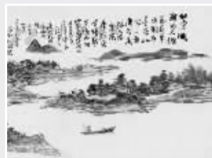
黄宾虹《山川卧游卷》(局部)